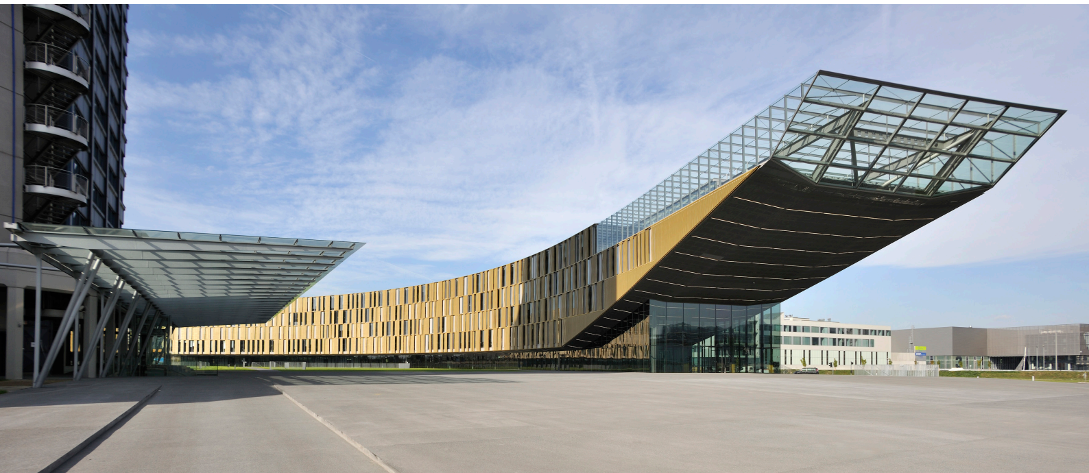
Centre de vente et des finances voestalpine, Linz 2009