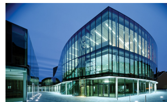
Centre Culturel, Weiz, Autriche 2005

Chaque site commande son projet. Considérer que chaque projet est un projet différent s'ancrant dans un site différent est un bon moyen pour éviter de sombrer dans l'habitude. À chaque fois, il faut chercher une réponse différente, en essayant d'être très moderne, très contemporain et, surtout, de ne pas définir un style a priori. Chaque site, paysage naturel ou paysage urbain commande son propre projet. Il peut s'agir de s'affirmer, se faire remarquer comme la passerelle Simone de Beauvoir ou bien au contraire, de se fondre dans le paysage, comme la jetée