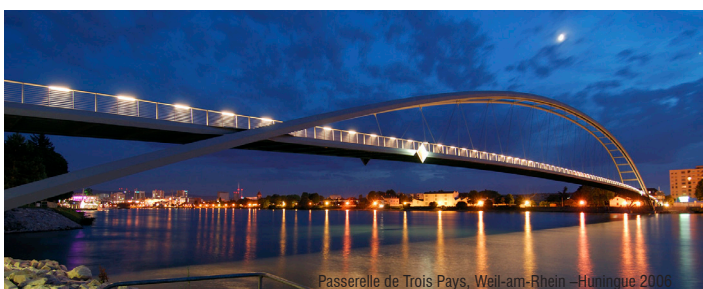
Passerelle de Trois Pays, Weil-am-Rhein -Huningue 2006